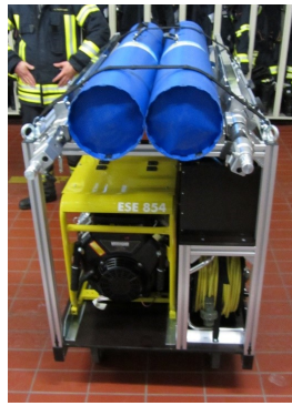
Rollwagen Licht und Strom

Landratsamt Landsberg am Lech Kreisbrandinspektion