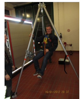
Auf- und Abseilgerät inkl. Zubehör